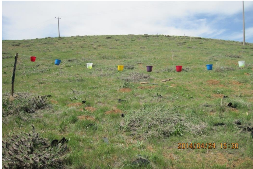
شکل ۲- تله‌های سطلی رنگی نصب شده در عرصه‌ی مرتعی ایستگاه تحقیقات کشاورزی سارال (استان کردستان).