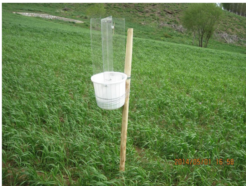
شکل ۱- تله‌ی پنجره‌ای نصب شده در عرصه‌ی زراعی ایستگاه تحقیقات کشاورزی سارال (استان کردستان).

مطالعه تعداد چهار عدد تله‌ی پنجره‌ای نصب شدند. هر ۲۰ روز یکبار نمونه‌های به دام افتاده در تله‌های مذکور جمع