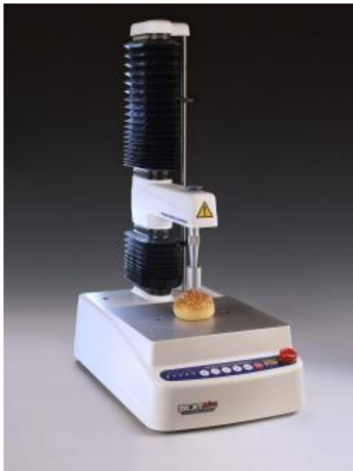
شکل ۲- دستگاه آنالایزر بافت مدل TA-XTplus