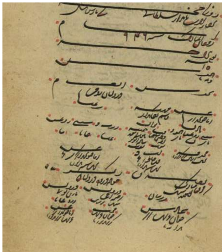
تصویر شماره یک: نمونه دفتر روزنامه

بنابراین روزنامه‌ها محل درج جزئی‌ترین دخل و خرج‌های دربار و دیوان به صورت روزانه بودند که پس از نوشتن توسط مشرفان و انجام فرایند اداری، این اطلاعات به تناسب موضوع به دفتر اوارجه و توجیهات منتقل می‌شد (تصویر شماره یک). لازم به توضیح است که دفتر روزنامه در دیوان عثمانی هم وجود داشت (نوری، ۱۳۹۰: ۱۴۱).