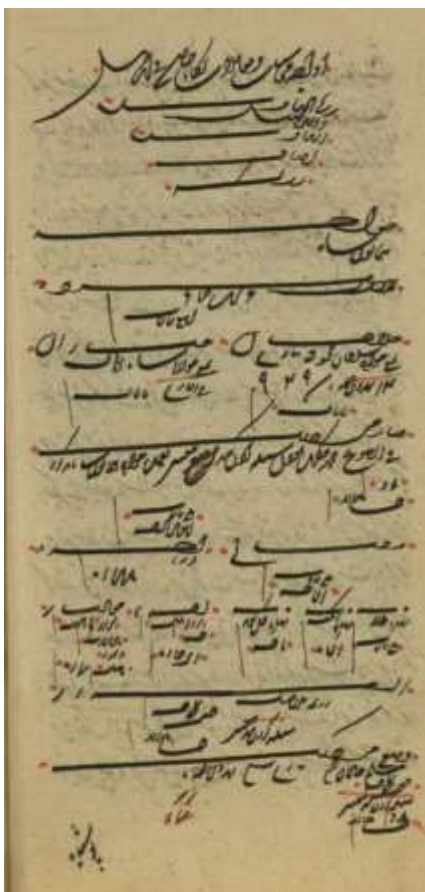
تصویر شماره دو: نمونه دفتر اوارجه