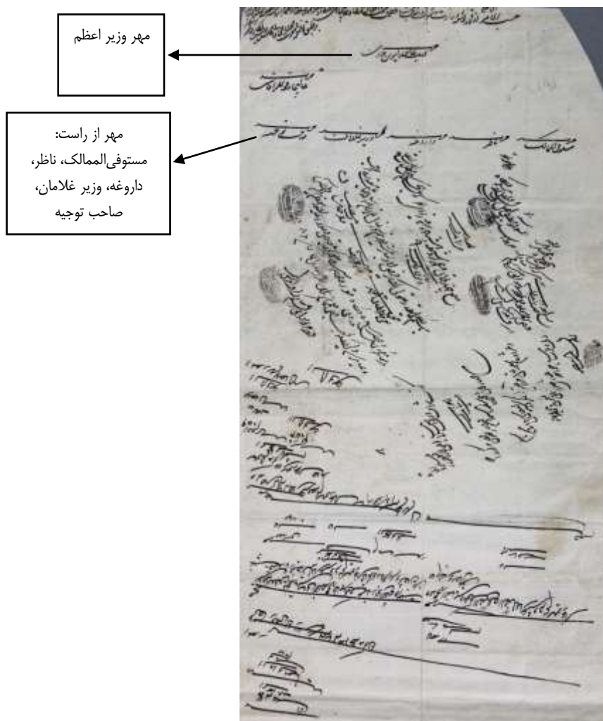
تصویر شماره سه: نمونه مهر و یادداشت های دفتری بر پشت سند

در دفترخانه توجیه، دفاتر مستوفی خاصه که شامل املاک و درآمدها و هزینه‌های شخص پادشاه، به همراه صورتی از املاک موروثی شاه و عایدات و مخارجی که پرداخته می‌شود و اسنادی را که باید مستوفی‌الممالک به آن‌ها عمل بکند وجود داشت. در این