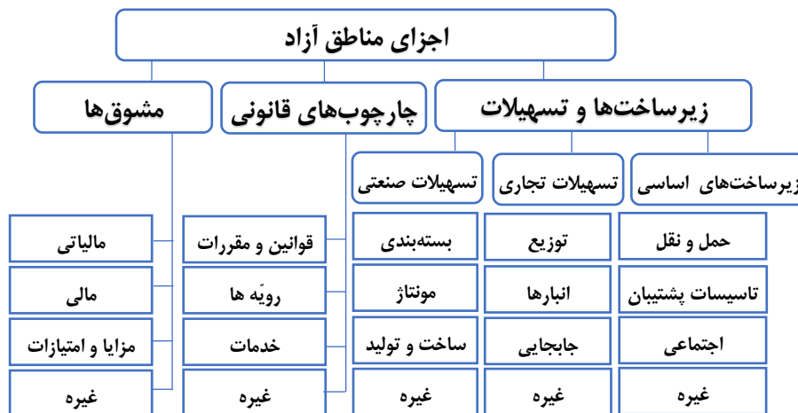
شکل ۴- مدل ارزیابی و بهبود عملکرد مناطق آزاد

در این راستا، مطالعه حاضر اجزای مناطق آزاد، از جمله چارچوب قانونی، مشوق‌ها و زیرساخت‌ها را مطابق شکل ۴ شناسایی، جمع‌بندی و در قالب مدل ارزیابی و بهبود عملکرد مناطق آزاد ارائه نموده است.