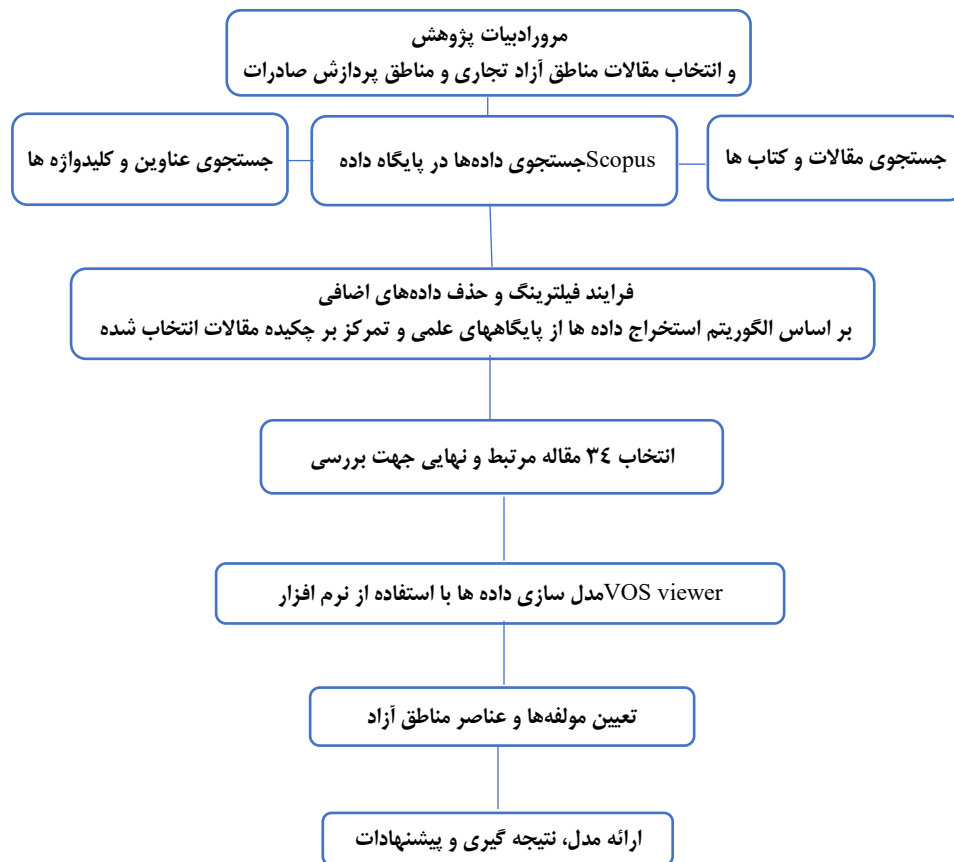
شکل ۱- الگوریتم روش‌شناسی پژوهش

پس از آن، ۱۷ مقاله دیگر از مرتبطترین مراجع جمع‌آوری و در نهایت، این فرایند با انتخاب ۳۴ مقاله به پایان رسید. خلاصه متدولوژی تحقیق در شکل ۱ نشان داده شده است.