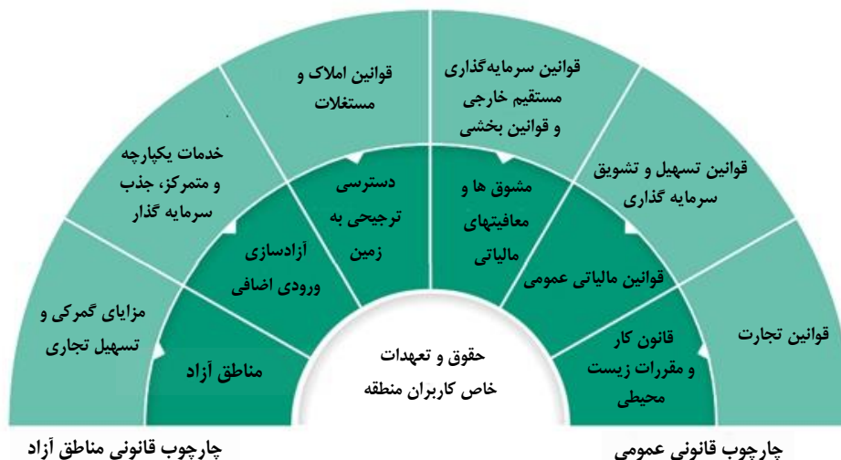
شکل ۵- عناصر اصلی چارچوب قانونی