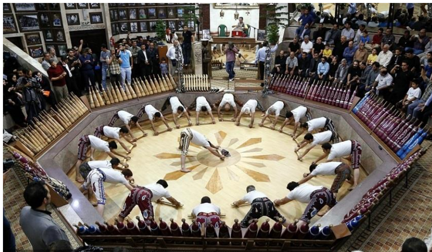
شکل ۱. تبلور فرهنگ ایرانی و اسلامی در گود زورخانه ها

بنابراین ورزش پهلوانی و زورخانه‌ای نماد فرهنگ ایرانی و اسلامی است که با ویژگی‌های مردانگی و صفات اخلاقی نیکو همراه می‌باشد. این ورزش با کمک به هموعان و مستضعفان ارتباطی عمیق برقرار می‌کند. از این رو، ترویج این ورزش ملی و مذهبی می‌تواند به کاهش بسیاری از آسیب‌ها و مشکلات اجتماعی کمک کند.