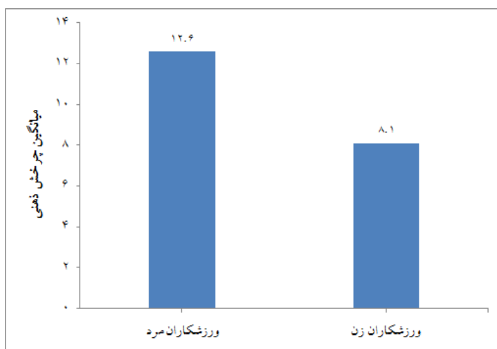
نمودار ۱- میزان چرخش ذهنی ورزشکاران زن و ورزشکاران مرد