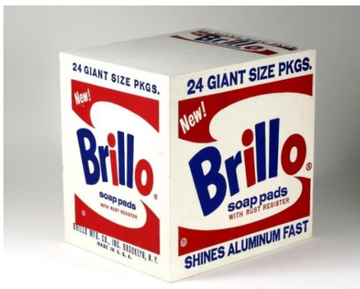
تصویر ۱. جعبه بریلو، اندی وار هول، ۱۹۶۴، تخته سه‌لا، ۴۳/۶×۳۵/۸ cm

از نظر دانتو، بین اثر هنری وار هول، با ابژه واقعی که در فروشگاه‌ها یافت می‌شوند «فاصله» وجود دارد، فاصله اثر هنری با واقعیت باعث می‌شود، اگرچه در ظاهر، دو شیء، همسان به نظر آیند اما اثر هنری، بهره‌مند از ویژگی‌هایی درونی، ناملموس و معنادار است که منجر می‌شود بین آن با شیء عادی تفاوت قائل شویم. اثر هنری، همیشه در یک فاصله از ابژه‌های واقعی قرار می‌گیرد که در صورت درک و توجه به آن، تمایزش انکارناشدنی است. «دانتو اهمیت اثر هنری را با ویژگی زبان مقایسه می‌کند، او می‌نویسد آثار هنری به همان فاصله فلسفی از واقعیت می‌ایستند که کلمات ... بسیار شبیه ظرفیت زبان برای مدل‌سازی جهان است که ابژه فلسفه می‌شود ...» (استرن، ۲۰۱۶، ۴۷۲).