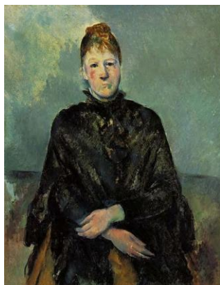
تصویر ۲. پرتره مادام سزان، سزان، ۱۸۸۷-۱۸۸۵، رنگ روغن روی بوم، cm ۷۲.۹×۹۲.۶