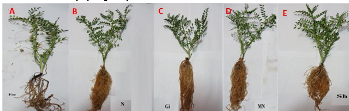
شکل ۲. تاثیر قارچ-ریشه Rhizophagus irregularis و نیتروکسین حاوی باکتری‌های Azospirillum و Azotobacter به تنهایی و ترکیبی بر رشد ریشه در گیاهان نخود زراعی آلوده و غیر آلوده به بیماری پژمردگی فوزاریومی (شاهد). A. تیمار بیماری بدون کاربرد کود، B. نیتروکسین، C. قارچ-ریشه، D. قارچ-ریشه + نیتروکسین، E. تیمار شاهد سالم بدون تلقیح بیماری و کود زیستی.

تاثیر دو قارچ میکوریز Funneliformis mosseae R. و C. Walker & A. Schüßler (T.H. Nicolson & Gerd.) irregularis بر بیماری پوسیدگی ریشه نخود فرنگی با عامل F. solani f. sp. pisi در شرایط گلخانه‌ای نشان داده است که کاربرد قارچ-ریشه توانسته سطوح مقاومتی گیاهان بیمار را با افزایش فاکتورهای رشدی افزایش دهد (Mohammadi & Kazemi 2002) که این نتایج با مشاهدات تحقیق حاضر مطابقت دارد. همانطور که در نتایج مقایسه میانگین دیده شد بیشترین کاهش بیماری مربوط به تیمار مخلوط قارچ-ریشه + نیتروکسین در گیاهان بیمار بود که می‌توان این استنباط را داشت که باکتری‌های ریزوسفر ریشه و قارچ همزیست ریشه در همکنش با هم، اثر سینرژیستی را بر کاهش بیماری داشته است. بررسی اثر کودهای زیستی نیتروکسین، قارچ-ریشه (میکوریز) و ورمی کمپوست در خیار گلخانه‌ای آلوده به بیماری مرگ گیاهچه ناشی از Pythium aphanidermatum (Edson) Fitzp باعث افزایش عملکرد و مقاومت نسبی خیار به بیماری مرگ گیاهچه شده است (Sabbagh et al. 2016).