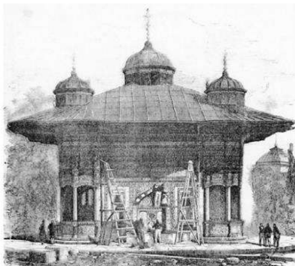
تصویر ۳: بنای کوشک سلطان احمد سوم عثمانی در نمایشگاه. (Fulco, 2017: 55).