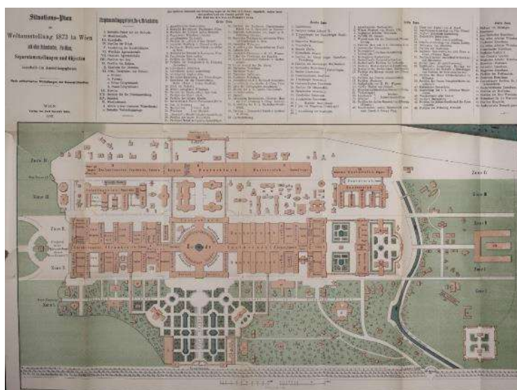
تصویر ۲: نقشه کلی و پلان غرفه بندی نمایشگاه جهانی ۱۸۷۳ وین (falke, 1873: 442)

به صورت مشترک به نام «ایران و آسیای مرکزی» در مجموع ۳۴۶ مترمربع بود که کمتر از فضای اولیه اختصاص داده شده بود (Blake & Pettit, 1873: 7). تعداد ۲۵/۷ میلیون نفر در طول شش ماه برگزاری این نمایشگاه از آن بازدید نمودند. تعداد انبوه بازدیدکنندگان از این نمایشگاه به خوبی اهمیت و عظمت آن را نسبت به چهار نمایشگاه قبلی و ۶ دوره نمایشگاه بعدی یعنی تا نمایشگاه ۱۸۸۹ میلادی پاریس که تعداد بازدیدکنندگان از ۱۶ میلیون نفر فراتر نرفت نشان می‌دهد (کهنسال نودهی، فولادی‌نسب، ۱۳۹۴: ۲۸).