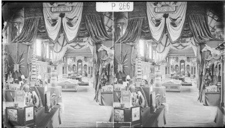
تصویر ۶: دو نما از غرفه ایران در نمایشگاه ۱۸۷۳ وین (Fulco, 2017: 57).

ناصرالدین‌شاه در ادامه ضمن ابراز رضایت از نتیجه تمهیدات بعمل آمده جهت شرکت در این رویداد می‌نویسد: «با وجودی که برخی متاع‌ها دیر رسیده و هنوز هم نرسیده و با وجودی که سه ماه قبل از این حکم شد تجار و غیره اسباب جمع کرده بفرستند و بسیار دیر بود، باز هم اسباب و متاع نفیس خیلی شد» (ناصرالدین‌شاه، ۱۳۶۸: ۲۹۹).