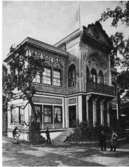
تصویر ۸: پاریون ایران در نمایشگاه ۱۸۷۳ وین. منبع: (Karl, 2014: 127).

حضور ناصرالدین‌شاه به‌عنوان یک پادشاه واقعی شرقی در نمایشگاه و در جمع بازدیدکنندگان، هنرهای صناعی و فرهنگ ایران را در کانون توجهات قرار داد و تبلیغات وسیعی در مورد حضور واقعی یک پادشاه شرقی در رسانه‌ها انجام شد. به‌ویژه اینکه «روح بازنمایانه حاکم بر فضای نمایشگاه هر چیزی به‌جز تماشاگر غربی را تبدیل به شیء می‌کرد. حتی زمانی که شاه واقعی یکی از سرزمین‌های شرقی به نمایشگاه می‌آمد قابلیت این را داشت که با سازوکارهای نمایشی و روح حاکم بر فضا جزئی از نمایشگاه شود» (دل‌زنده، ۱۳۹۴: ۱۵۵) (تصویر ۹).