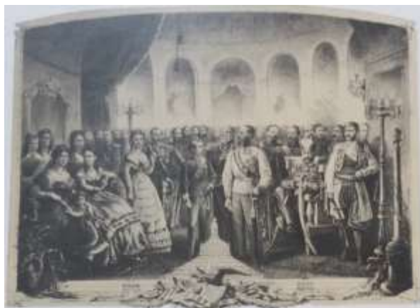
تصویر ۹: ناصرالدین شاه نشسته بر تخت، در بین بازدیدکنندگان نمایشگاه جهانی ۱۸۷۳ وین (Stanzer, 1986: 46).