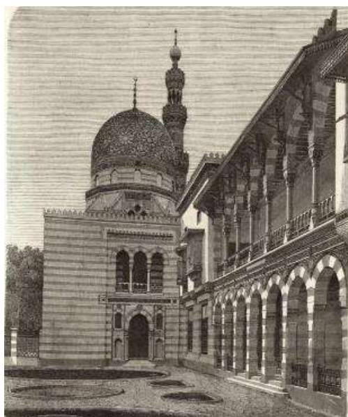
تصویر ۴: پابون مصر در نمایشگاه (https://digi.ub.uni-heidelberg.de/diglit/luetzow1875/0078).