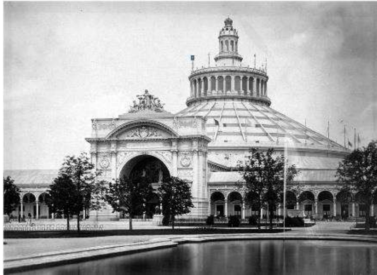
تصویر ۱: ساختمان مرکزی نمایشگاه که اختصاص به کشور اتریش و آلمان داشت ( Fulco, 2017: 54).

مجموع فضای داخلی نمایشگاه شامل گنبد مدور و فضای سرپوشیده حدود ۶۰۰۰۰ مترمربع بود که به کشورهای شرکت‌کننده به تناسب اهمیت و تنوع تولیدات آن اختصاص داده شده بود. علاوه بر گنبد مرکزی و سالن اصلی نمایشگاه، تعداد ۱۹۴ ساختمان نمایشگاهی از جمله گالری هنر و پویون‌های خصوصی در محوطه نمایشگاه احداث شده بود (تصویر ۲).