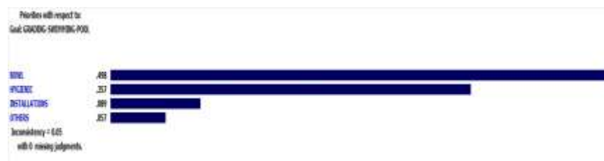
شکل ۱: وزن‌های شاخص‌های استاندارد سالن‌ها

در جدول زیر وزن‌های هر یک از شاخص‌ها گزارش شده است.