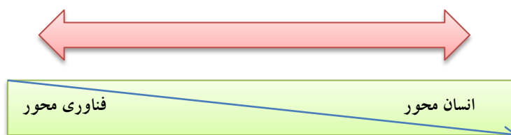
(شکل-۱): طیف جرایم سایبری از انسان محور تا فناوری محور

یک رویداد فردی و مجزا به شمار می‌روند و اغلب توسط ورود بدافزارها به رایانه‌ی قربانی تسهیل می‌شود و ممکن است زمینه این رخداد توسط خود قربانی فراهم شود. نوع دوم: با برنامه‌هایی که زیر مجموعه بدافزارها قرار نمی‌گیرند، تسهیل می‌شوند (پژوهش جهرمی، ۱۳۹۷: ۶۱). جرایم سایبری طیفی را شامل می‌شود که یک سمت آن متکی بر فناوری و سوی دیگر این طیف، متکی بر روابط بین فردی. (شکل-۱)