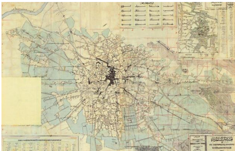
تصویر ۱: نقشه دارالسلطنه تبریز، ۱۳۲۷ ق. (اسدالله مراغه‌ای)، (فخاری تهرانی و همکاران، ۱۳۸۵: ۶۵)