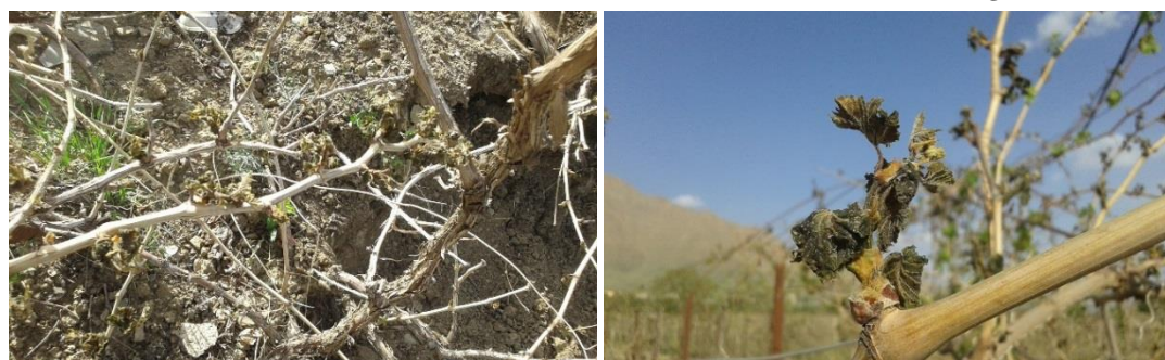
شکل ۲- خشک شدن جوانه شاخه‌ها در اثر سرمای دیررس بهاره در سال اول آزمایش (سال ۱۳۹۴).

مطابق نتایج شکل ۱ بیشترین مقدار طول شاخه در تیمارهای آبیاری I1، I2، I3، I4 و I5 از سال اول به ترتیب ۱۴۲، ۱۴۵، ۱۴۷، ۱۳۲ و ۱۳۵ سانتی‌متر در اندازه‌گیری چهارم (۱۵۰ روز از سال) است. در مقابل کمترین مقدار طول شاخه در تیمارهای آبیاری فوق به ترتیب ۱۱۰، ۱۲۰، ۱۰۸، ۱۰۵ و ۱۱۰ سانتی‌متر در اندازه‌گیری اول (۸۳ روز از سال) مشاهده شد. از طرفی در سال دوم آزمایش بیشترین مقدار طول شاخه در تیمارهای آبیاری I1، I2، I3، I4، I6 و I7 به ترتیب ۱۰۷، ۱۱۲، ۱۰۰، ۱۰۵ و ۱۴۴ سانتی‌متر در اندازه‌گیری چهارم و کمترین مقدار طول شاخه به ترتیب ۷۱، ۷۰، ۷۱، ۶۷ و ۶۷ سانتی‌متر در اندازه‌گیری اول (۸۳)