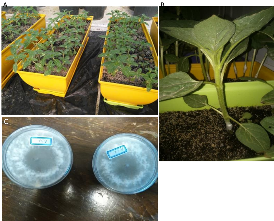
شکل ۱- A: نمایی از لاین‌های کشت شده در شرایط کنترل شده، B: گیاه آلوده شده با بیمارگر Sclerotinia sclerotiorum جدایه A37 و C: شکل ظاهری قارچ بیمارگر در محیط کشت Potato dextrose agar