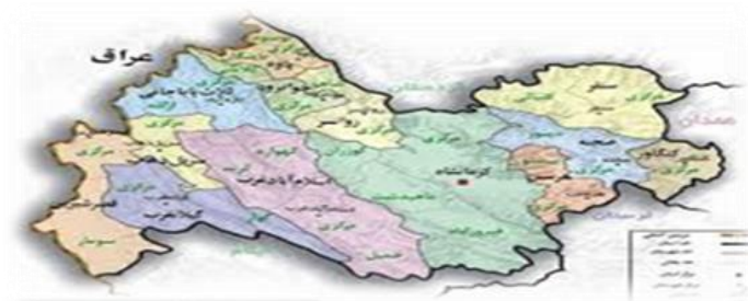
شکل شماره ۱: نقشه جغرافیایی محدوده مورد مطالعه

شهر اسلام‌آبادغرب، دومین شهر استان کرمانشاه است دارای وسعتی بالای ۲۰۰۰ کیلومتر مربع و ۸/۵ درصد از وسعت استان را به‌خود اختصاص داده است. این شهر در طول جغرافیایی ۴۶ درجه و ۳۱ دقیقه و در عرض جغرافیایی ۳۴ درجه و ۶ دقیقه و در بلندی ۱۳۳۵ متری از سطح دریا قرار دارد و در ۶۵ کیلومتری جنوب باختری کرمانشاه و در مسیر راه کرمانشاه-خسروی قرار دارد. دارای ۲ بخش، ۷ دهستان و ۱۷۳ روستا است (General Population and Housing Census, 2011).