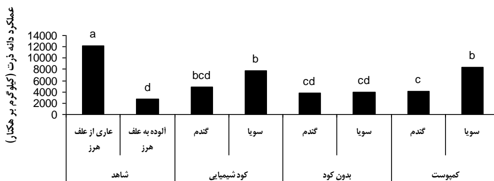
شکل ۲- عملکرد دانه ذرت در تیمارهای کودی و گیاه پوششی

کمپوست و کود شیمیایی از نظر آماری معنی‌دار نشد. افزایش عملکرد ذرت هنگام کاشت بذور چند لگوم در مرحله ظهور گل‌آذین نر در بین ردیف‌های این گیاه در مقایسه با شاهد (بدون گیاه پوششی) گزارش شده است (اولنس و لوپز ۲۰۰۰). حمزه‌ای و بوربور (۲۰۱۴) نیز گزارش دادند که بیشترین عملکرد دانه ذرت در شرایط کشت گیاهان پوششی ماشک گل خوشه‌ای و خلر (به ترتیب ۱۱۱۹ و ۱۱۲۲ گرم در متر مربع) و کمترین آن (۹۵۷ گرم در متر مربع) در شرایط عدم کشت به دست آمد.