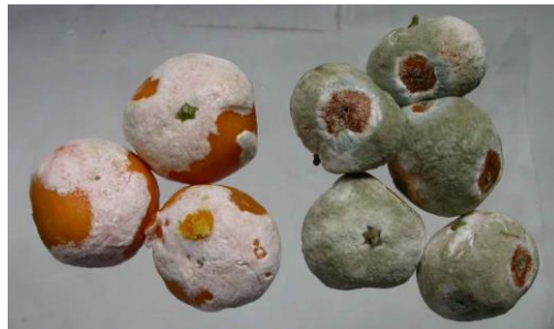
شکل ۵- تولید اسپور فراوان توسط بیمارگر در تیمار با سوسپانسیون بیمارگر (میوه‌های سمت راست) و عدم تولید اسپور توسط بیمارگر در اثر استفاده از عصاره سرخاب کولی (میوه‌های سمت چپ)

همچنین گزارش شده که این گونه دارای پروتئینی است که دارای خاصیت ضد ویروس است (زوبنکو و همکاران ۲۰۰۰). از گونه‌های دیگر این تیره گونه P. tetramera می‌باشد که بخاطر داشتن مواد سایونین بر روی قارچهای بیمارگر فرصت طلب، موثر می‌باشد (اسکالانت و