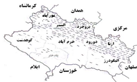
شکل ۱- مناطق عمده کشت شبدر ایرانی (هاشور خورده) در استان لرستان

از سال ۱۳۸۱ برای تهیه جدایه های بومی به روش پیمایشی از کل مناطق زیر کشت شبدر ایرانی