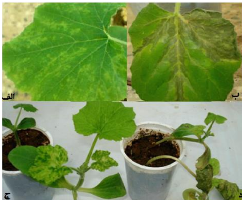
شکل ۱- الف و ب) علائم ۱۰ روز پس از مایه زنی روی گیاه کدو به صورت: الف) موزائیک خفیف حاصل از جدایه Mgh191 (ب) نکروز پیش رونده در برگ حاصل از جدایه Bas3 (ج و د) توسعه علائم ۲۰ روز پس از مایه زنی روی گیاه کدو به صورت: ج) موزائیک ناشی از Mgh91 و د) نکروز منتهی شونده به مرگ گیاه ناشی از Khn1.

۲ میانگین‌هایی که با حروف مشابه علامت‌گذاری شده اند براساس آزمون دانکن در سطح احتمال ۵٪ در یک گروه قرار دارند.