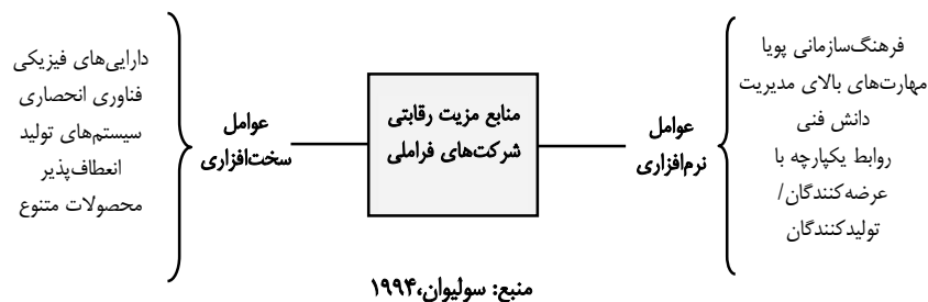
شکل ۱: منابع مزیت رقابتی شرکت‌های فراملی

بسیاری از بودجه‌های تحقیقاتی در اختیار شرکت‌های فراملی قرار می‌گیرد. یکی از دلایل این موضوع توان بالای فناوریانه، سرمایه انسانی قوی و انعطاف‌پذیری مالی این شرکت‌هاست. این عامل خود به بالندگی و افزایش توان دانشی این شرکت‌ها منجر می‌گردد. بسیاری از دولت‌ها، بالأخص در کشورهای فقیر، توانایی مقابله با نفوذ سیاسی و اقتصادی شرکت‌های فراملی را ندارند. مفهوم شرکت‌های فراملی باید به صورت یک پدیده نهادی و چندبعدی در نظر گرفته شود که شامل زمینه‌های فرهنگی، سیاسی، فناوری و اقتصادی است. فرایند تبدیل یک شرکت از حالت اولیه به یک شرکت فراملی در وهله اول مستلزم تغییر در راهبردهای کلان آن است. شکل شبکه سلسله‌مراتبی به شرکت‌های فراملی فرصت می‌دهد که هزینه مبادله را کاهش داده و انعطاف‌پذیری مبادلات را بالا ببرند. به علاوه این شرکت‌ها، ریسک‌های فعالیت را به طرفین قرارداد خود منتقل نموده تا تمرکز خود را بر فعالیت‌های دارای ارزش افزوده اقتصادی بالاتر و ریسک‌پذیری کمتر منتقل کنند. مزیت رقابتی شرکت‌های فراملی را از دو بعد می‌توان بررسی کرد: عوامل سخت‌افزاری و عوامل نرم‌افزاری که به‌طور خلاصه در شکل ۱ نشان داده شده‌اند (سالیوان، ۱۹۹۴).