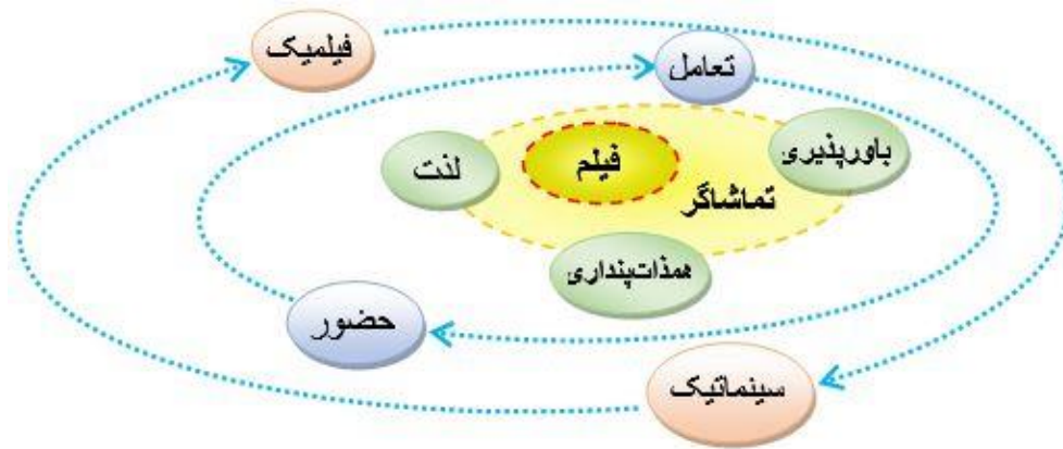
شکل (۲). مدل «حلقه ادراکی-تجربی»

باید اذعان داشت عیلرغم تغییرات مدام و مختلف در الگوهای فیلمسازی، تکرار و تشابه ویژگی‌های متداولی هستند که نمی‌توان آن‌ها را نادیده گرفت. روایت و فرم فیلم جزء عناصر فیلمیک و فرمال بشمار می‌آیند که از این دو شاخص بهره می‌گیرند، اما همانگونه که هیچ موجود همسانی کامل شبیه همزادش نیست هر فیلم نیز تنی متمایز از تن دیگری است و برای مخاطبش تازه به شمار می‌آید. تماشاگر آگاهانه برداشت‌ها و قضاوت‌های خود را کنار می‌گذارد تا در فضای سیالی قرار گرفته تا ضمن درک ماهیت اثر به خود نیز در این رابطه هویت ببخشد. احساس داده‌ها نسبی است و وابسته به فضای ایدئولوژیک و فنی است. سینما تنی زنده و در حال رشد است که دائم بسوی هدف آرمانی ندانسته‌اش در حرکت و تغییر است. سینما این هست و نیست. ادراک فیلم، یک جریان دوطرفه است. فیلم، با ساختار و سبک خود، چهارچوبی برای تجربه تماشاگر فراهم می‌کند، اما این خود تماشاگر است که با فعال‌سازی ظرفیت‌های شناختی، عاطفی و بدنی خود، این چهارچوب را پر کرده و به آن روح می‌بخشد. مدل «حلقه ادراکی-تجربی» نشان می‌دهد که معنای فیلم نه در خود سلولوئید یا فایل دیجیتال، و نه صرفاً در ذهن تماشاگر، بلکه در فضای پویا، بدنمند و تعاملی «بین» این دو خلق می‌شود.