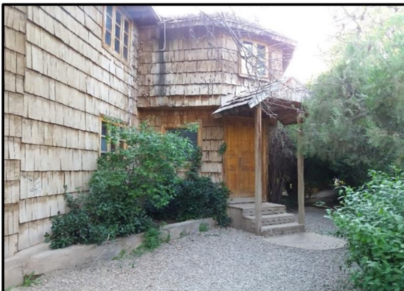
شکل ۴. کتابخانه چوبی