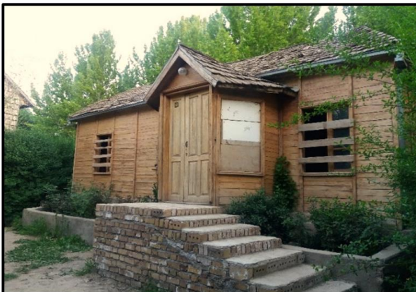
شکل ۶. مراکز اقامتی ساخته شده از چوب