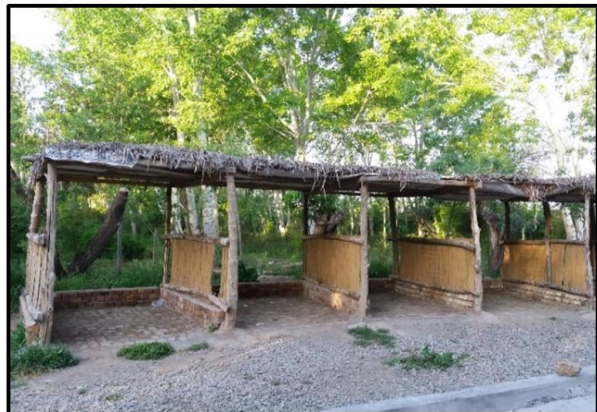
شکل ۷. الایچیق‌های مجموعه

ساختار پژوهش در مطالعه حاضر، با تکیه بر شیوه توصیفی و تحلیلی و با هدف ارزیابی ویژگی‌های مناظر روستایی با رویکرد توسعه گردشگری در این مناطق، تنظیم شده است. این پژوهش در دو بخش تنظیم شده است؛ که در آغاز با تکیه بر شیوه توصیفی و تحلیلی و به صورت مطالعات اسنادی-کتابخانه‌ای، ویژگی‌ها و شاخص‌های مناظر روستایی تبیین شده، سپس با استناد به مطالعات کتابخانه‌ای و مشاهدات میدانی، مشاهده نقشه‌ها و عکس‌برداری، به بررسی منطقه در رابطه با ویژگی‌های منظر روستای مذکور پرداخته می‌شود. در نهایت پژوهش حاضر، با استفاده از ابزار پرسشنامه و آزمون‌های مربوطه، به بررسی تأثیر ویژگی‌های مناظر روستایی بر توسعه گردشگری در مناطق دارای توان جذب گردشگر و در نهایت ارتقای صنعت گردشگری