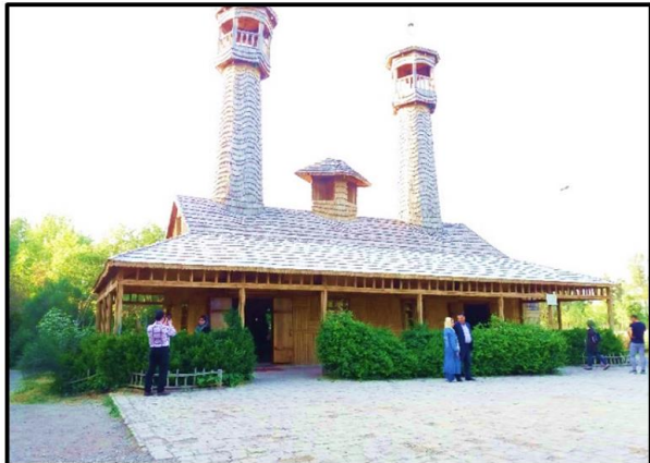
شکل ۳. مسجد چوبی