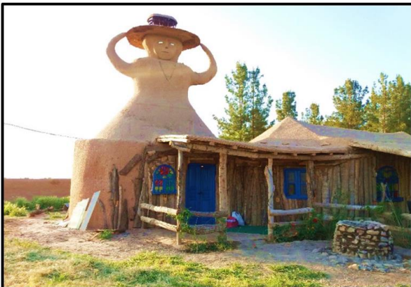
شکل ۸. نانوايي و پخت نان‌های محلی