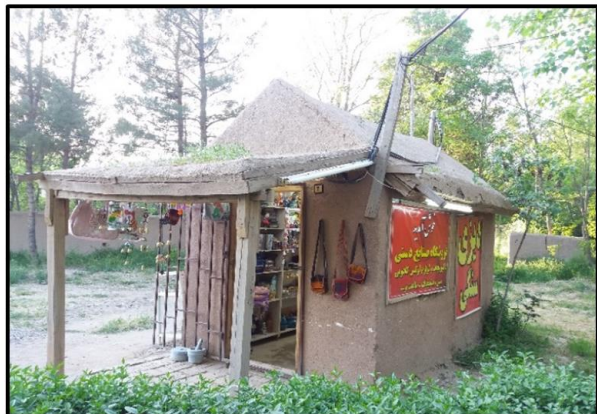
شکل ۵. فروشگاه‌های صنایع دستی (منبع: نگارنده)